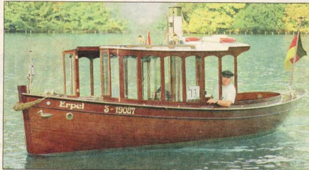
Der Dampfboot-Kapitän von der «Erpel» aus Deutschland schippert gern auf Schweizer Seen.