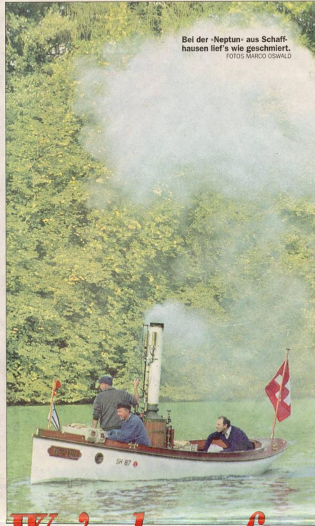
Bei der «Neptun» aus Schaff- hausen lief's wie geschmiert.

K 7 7 ihm uide ack. der Kö- ion. mn- gen. an c je en? che- ihm llen nen. den RUTT ! d- u- i, ). iss nd um ns in dy in nd u.